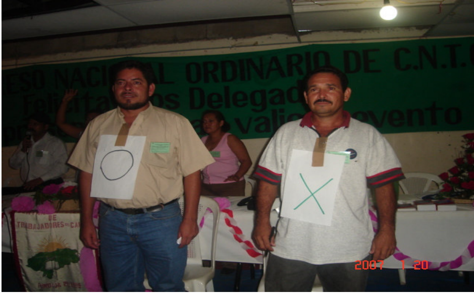
Candidatos a cargos de la Junta Directiva Nacional, en pleno proceso eleccionario.