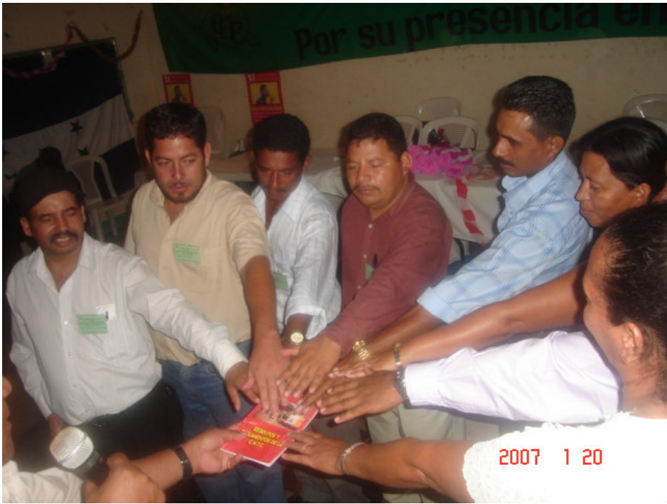
Juramentación de la Junta Directiva Nacional 2007-2009.